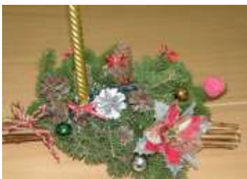
Рис. 6 - Конкурс «Зимняя феерия»