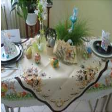
Рис. 4. – Конкурс «Встречаем Пасху»