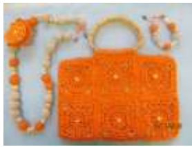
Рис. 3 – Олимпиадный проект «Краски осени»