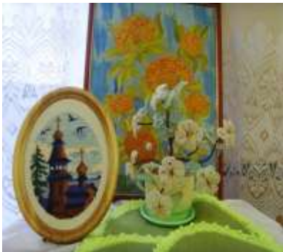
Рис. 5 – Выставка детского творчества