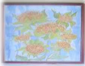
Рис. 1 – Олимпиадный проект «Волшебные цветы»