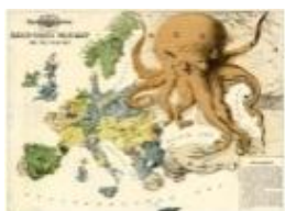
«Полушутливая военная карта на 1877 г.». Лондон, 1914 г.