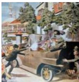
Убийство в Сараево эрцгерцога Франца Фердинанда 28 июня 1914 г.