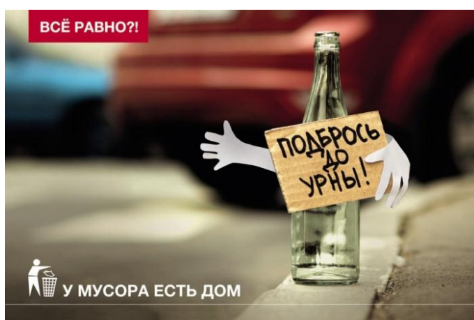
ПРИМЕР СОЦИАЛЬНОЙ РЕКЛАМЫ