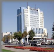
Аптека №1 и диагностический центр

Могилев 1970-е. Это место знают все. Что сегодня вместо этого здания?