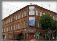
Улица Первомайская, 21, здание Беларусбанка

Могилев конец XIX в. Гостиница "Метрополь". Что сегодня на этом месте?