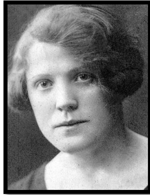
Хоружая Вера Захаровна (27.09.1903–04.12.1942)

Герой Советского Союза (17.05.1960), организатор антифашистского подполья в городе Витебске в Великую Отечественную войну.