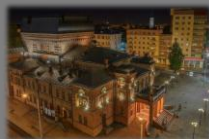
Могилевский областной драматический театр

Могилёв, конец XVIIIв. Что сегодня на этом месте?