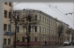
Средняя школа №1

Могилев 1910-е года. На фото виден один из первых кинотеатров Могилева – Кинотеатр Модерн.