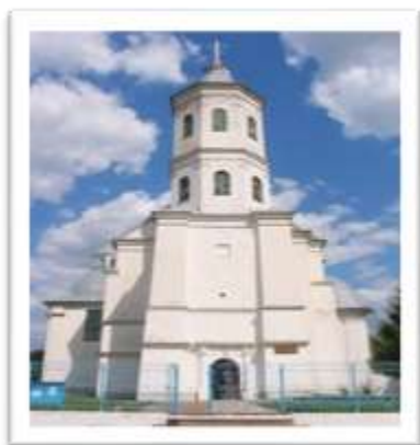
Свято-Троицкая церковь (Слоним)