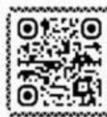
За того парня

Ребята под гитару исполняют песню «За того парня» или слушают аудиофайл «Поклонимся великим тем годам».