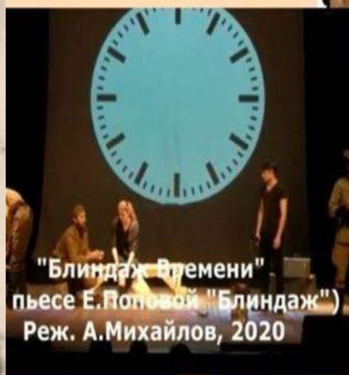
"Блиндаж Времени" пьесе Е.Поповой ("Блиндаж") Реж. А.Михайлов, 2020

Маленькие истории большой Победы КОНКУРС ЭССЕ