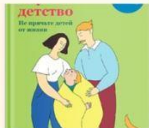
Детство По причтам детей от жизни