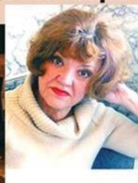
Е. ПОПОВА БЛИНДАЖ

«Дорогой героев, дорогой отцов...» мы пройдем с теми, кто пережил войну или писал о ней, кто смог передать этот опыт будущим поколениям.