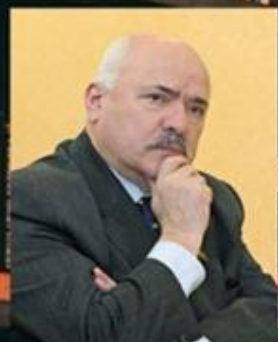
Н. ЧЕРГИНЕЦ СЫНОВЬЯ