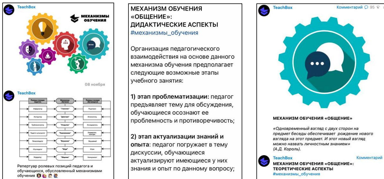
Рисунок 3. Примеры публикаций рубрики «Механизмы обучения»

Задача второй ключевой рубрики Telegram-канала «Teach Vox» – на материале о механизмах обучения раскрыть теоретические, дидактические и методические аспекты различных способов организации взаимодействия педагога с обучающимися в учебном процессе (рисунок 3).