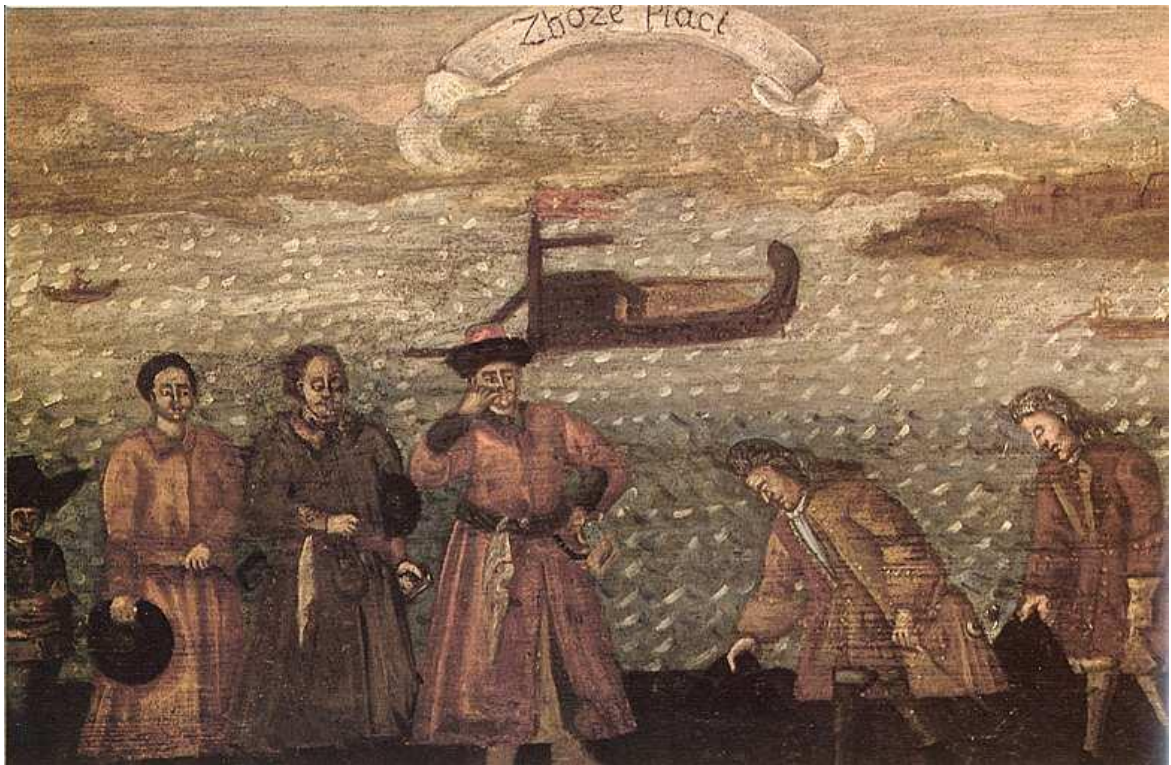
Приложение 5. Ребус.