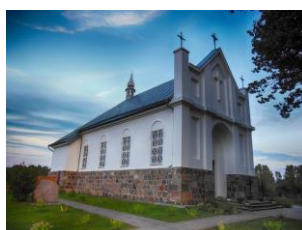
1. Костел Божьего Тела