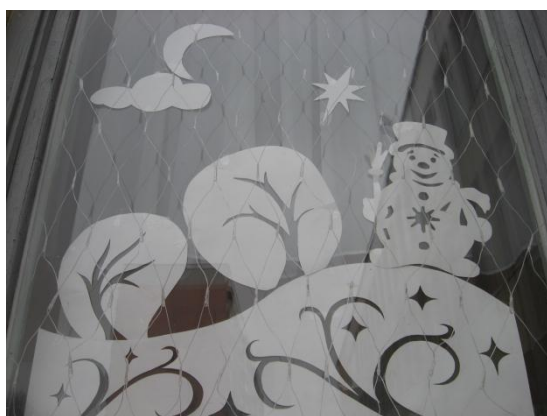
Украшение окна вытинанкой к Новому году.