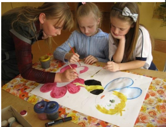
Коллективное творчество – эмблема отряда для школьного лагеря