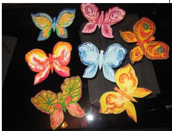
Бабочки (коллективная работа)