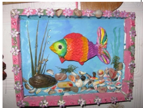
Коллаж «Золотая рыбка» (Козлова И.)