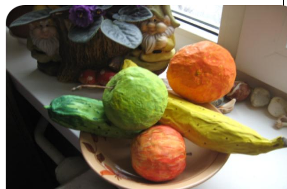
Коллективная исследовательская работа «Возможности изготовления муляжей»