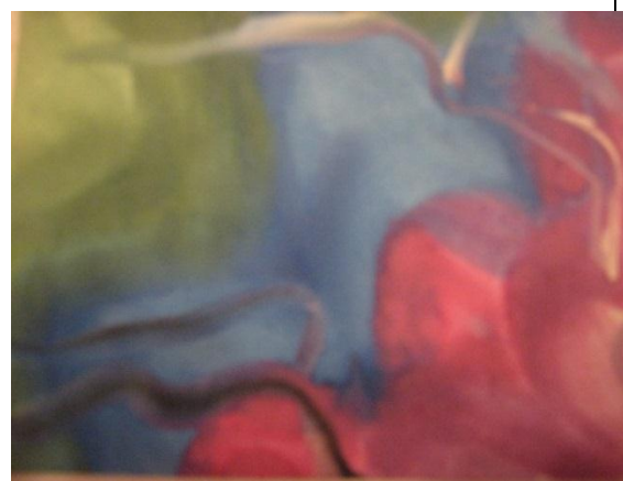
Цветные сны (Макаренко Ю.)