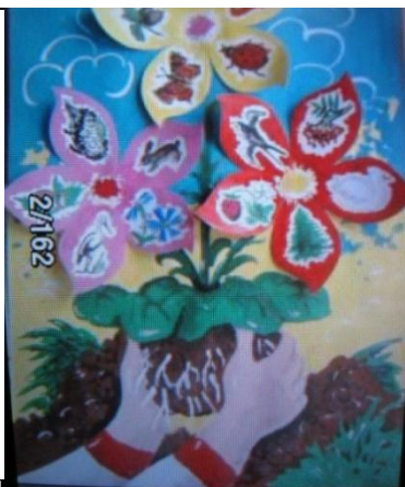
Коллективная творческая работа «Сохраним биологическое разнообразие»