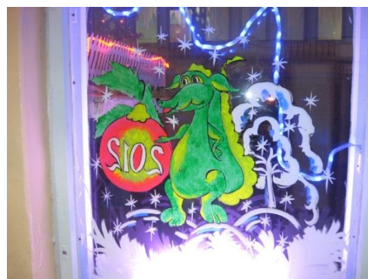
Роспись окна к Новому году