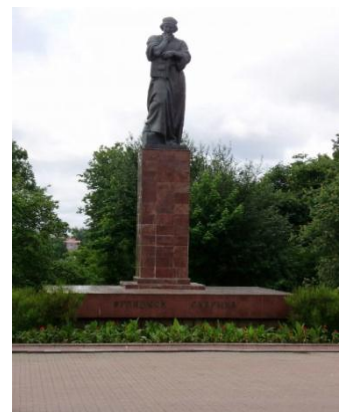
Памятник Ф. Скорине