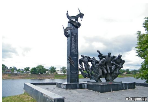
Памятник 23 гвардейцам