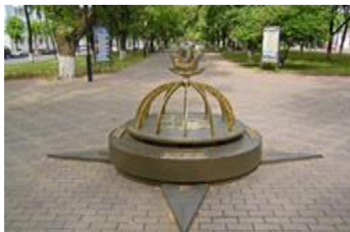
Памятник «Полоцк — географический центр Европы»