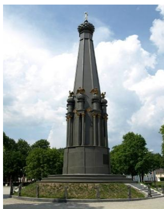
Памятник героям Отечественной войны 1812 года