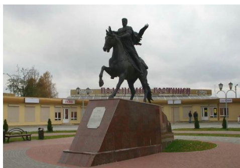
Памятник Всеславу Чародею