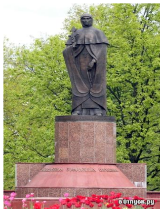
Памятник Е. Полоцкой