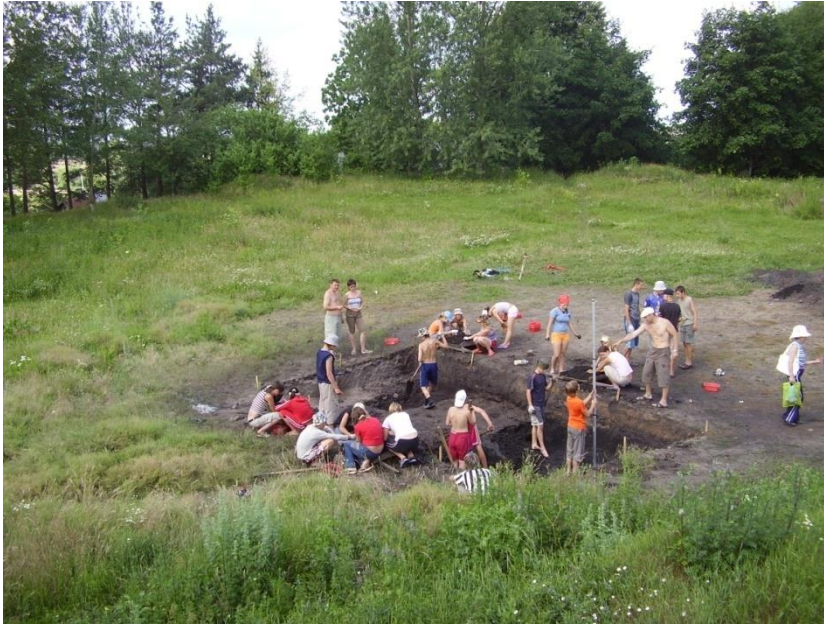
На раскопках у Свіслачы