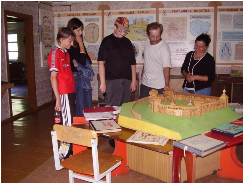
У музеі Свіслацкай школы

На працягу шэрагу гадоў вучні з'яўляюцца ўдзельнікамі Рэспубліканскага фестывалю «Дзень Зямлі», Рэспубліканскай акцыі навучэнцаў «Жыву ў Беларусі і тым ганаруся».