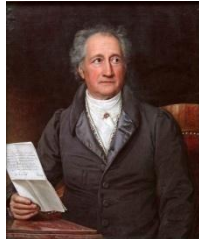
Johann Wolfgang von Goethe

Sie war eine mexikanische Malerin . Sie zählt zu den bedeutendsten Vertretern einer volkstümlichen Entfaltung des Surrealismus.