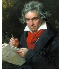
Ludwig van Beethoven

Er war amerikanischer Sänger und gilt als einer der wichtigsten Vertreter der Rock- und Popkultur des 20. Jahrhunderts. Er ist auch als „King of Rock ‘n’ Roll“ bekannt.