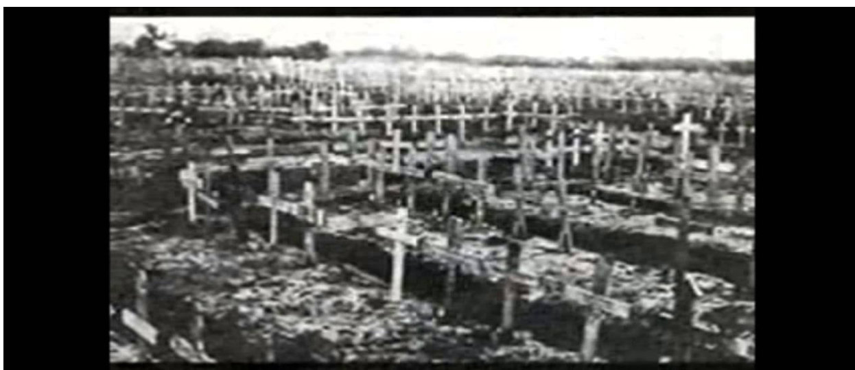
Вынікі “Вердэнскай мясарубкі”