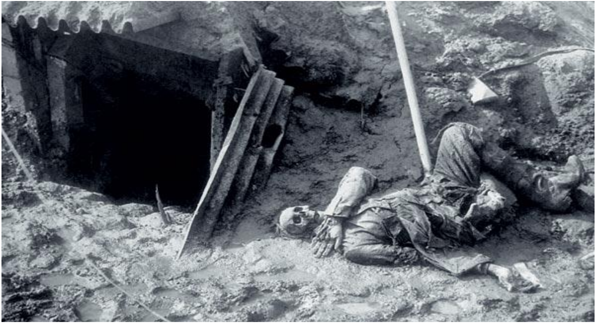
Фотаздымак “Вердэнская мясарубка”