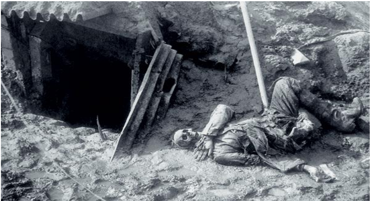
Фотаздымак “Вердэнская мясарубка”