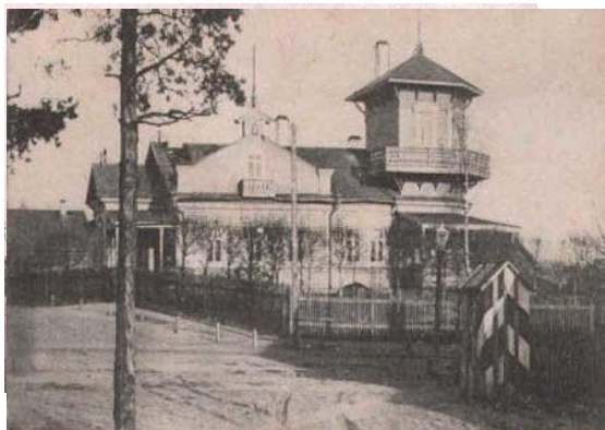
Рис.1 Костел (нач XX ст.)

ЖИВОПИСЬ И АРХИТЕКТУРА БЕЛАРУСИ В 1860-Х ГГ. — НАЧАЛЕ XX В.