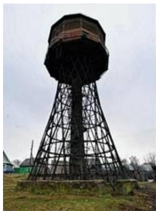
Рис.2 Гиперболоидная водонапорная башня нач. XX века

Ссылка на сайт https://borisov-lic.do.am/