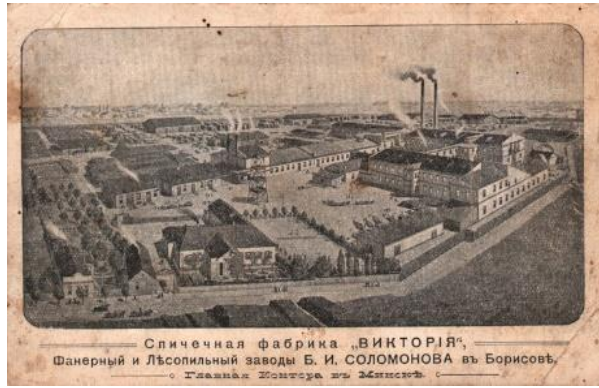
Рис.3 Спичечная фабрика «Виктория»

Начали строиться фабрики и заводы. Среди них наиболее крупными были спичечные фабрики «Виктория» и «Березина», бумажная фабрика «Папирус», стекольный завод, несколько лесопильных заводов, судостроительная верфь.