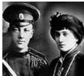
Анна Ахматова и Николай Гумилёв

Начало 10-х годов было определено в её судьбе важными событиями: она вышла замуж за Николая Гумилёва, обрела дружбу с художником Амадео Модильяни и выпустила первую книгу «Вечер», принёсшую ей мгновенную славу.