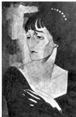
Портрет работы Ю. П. Анненкова, 1921