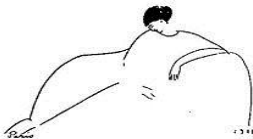
Анна Ахматова на рисунке Модильяни, 1911 год