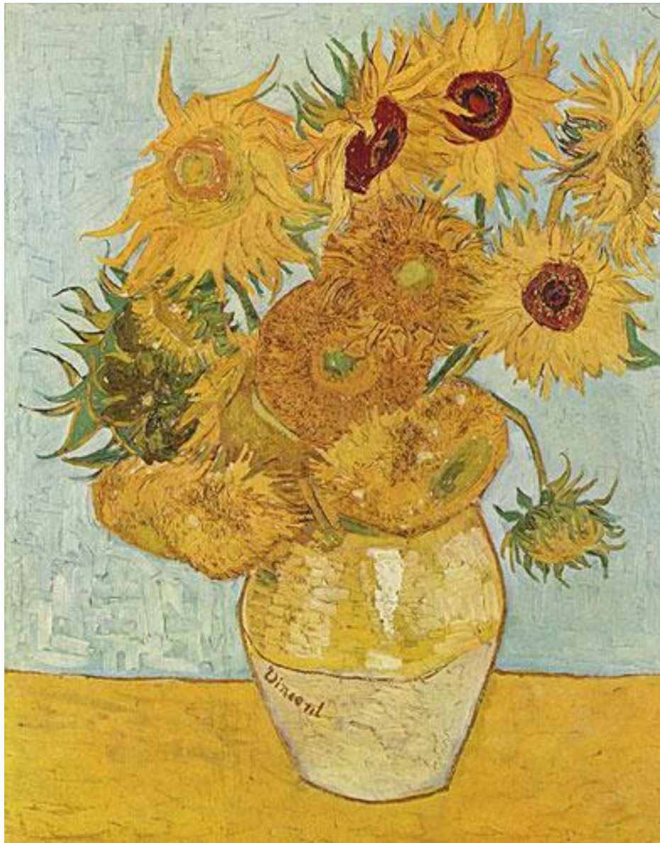
3. Sunflowers – Vincent Van Gogh