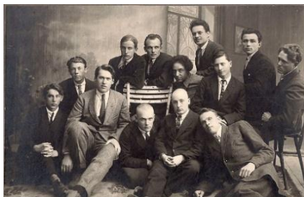
Літаратурнае згуртаванне “Узвышша”.

Туды ўваходзілі К.Чорны, У.Дубоўка, К.Крапіва, Я.Пушча і іншыя.