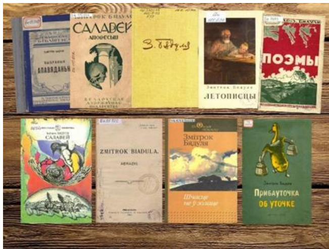
Тэматыка творчасці Змітрака Бядулі

Настаўнік. Старонкі аповесці Змітрака Бядулі (1886-1941) “Салавей” вяртаюць нас у мінулае нашай Бацькаўшчыны. Письменник гістарычна праўдзіва намалюваў карціну жыцця сялянства ў тую змрочную пару – у час прыгону: звярыную жорсткасць паноў, іх пагарду да ўсяго беларускага – да імен, да мовы, да нацыянальнай культуры. Але ніякія катаванні не маглі заглушыць народныя таленты, прыгажосць душы народа.